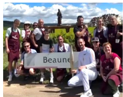
Les vignerons de l'appellation Beaune arborant fièrement leur panneau lors du passage de la Flamme Olympique le 12 juillet 2024.